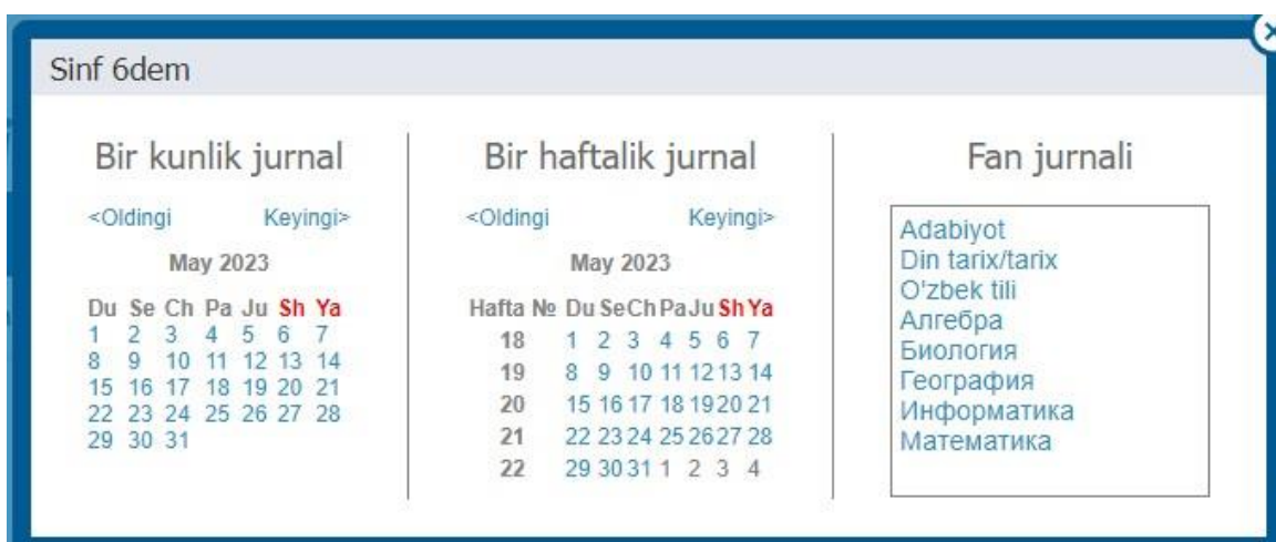
1 - rasm - Jurnallarga o'tish

Jurnal sahifasini ochgandan so'ng (2-rasm) kursorni katakka qo'yib, kompyuter klaviaturasidan baholarni kiritishingiz kerak.